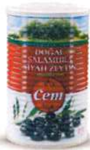
Az Tuzlu Doğal Salamura Siyah Zeytin

Ürün Tanımı :Az Tuzlu Salamura Siyah Zeytin Ürün Kodu :152.CEM.GSS.T0008 Ambalaj :Teneke Ağırlık :800 gr