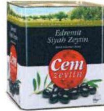
Edremit Siyah Zeytin

Ürün Tanımı :Az Tuzlu Salamura Siyah Zeytin Ürün Kodu :152.CEM.GSS.T0008 Ambalaj :Teneke Ağırlık :800 gr