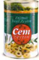
Dilimli Yeşil Zeytin

Ürün Tanımı :Dilimli Yeşil Zeytin Ürün Kodu : 152.CEM.DYZ.K0001 Ambalaj :720 cc Kavanoz Ağırlık :300 gr