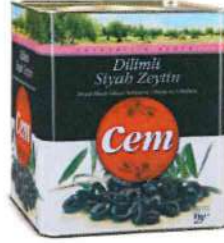
Dilimli Siyah Zeytin

Ürün Tanımı :Dilimli Siyah Zeytin Ürün Kodu :152.CEMDSZ.T0001 Ambalaj :Teneke Ağırlık :8 kg