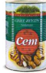
Grill Zeytin Salatası (Salamurahlı)

Ürün Tanımı :Grill Zeytin Ürün Kodu :152.CEM.GRL.K0005 Ambalaj :720 cc Kavanoz Ağırlık :360 gr