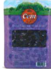
Doğal Sele Siyah Zeytin

Ürün Tanımı: Doğal Yağlı Sele Siyah Zeytin Ürün Kodu: 152.CEM.GYS.V0001 Ambalaj: Vakumlu Ağırlık: 200 gr