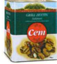
Dilimli Yeşil Zeytin

Ürün Tanımı :Dilimli Yeşil Zeytin Ürün Kodu :152.CEM.DYZ.T0004 Ambalaj :Teneke Ağırlık :2.5 kg