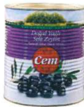
Doğal Sele Siyah Zeytin

Ürün Tanımı: Doğal Yağlı Sele Siyah Zeytin Ürün Kodu: 152.CEM.KYS.K0001 Ambalaj: Kase Ağırlık: 800 g