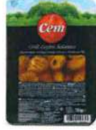
Grill Zeytin Salatası (Yağlı)

Ürün Tanımı :Grill Zeytin Salatası Ürün Kodu :152.CEM.GRL.V0001 Ambalaj :Vakumlu Ağırlık :150 gr