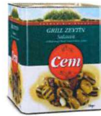
Grill Zeytin Salatası (Salamurahlı)

Ürün Tanımı :Grill Zeytin Salatası Ürün Kodu :152.CEM.GRL.T0004 Ambalaj :Teneke Ağırlık :4 kg