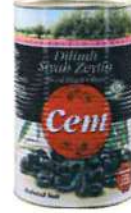
Dilimli Siyah Zeytin

Ürün Tanımı :Dilimli Siyah Zeytin Ürün Kodu : 152.CEM.DSZ.K0001 Ambalaj :720 cc Kavanoz Ağırlık :300 gr