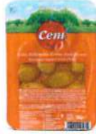
Soslu Kalamata Kırma Yeşil Zeytin

Ürün Tanımı :Soslu Kalamata Kırma Yeşil Zeytin Ürün Kodu :152.CEM.SYZ.V0003 Ambalaj :Vakumlu Ağırlık :150 gr