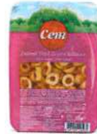
Dilimli Yeşil Zeytin Salatası

Ürün Tanımı :Soslu Kalamata Kırma Yeşil Zeytin Ürün Kodu :152.CEM.SYZ.V0003 Ambalaj :Vakumlu Ağırlık :150 gr