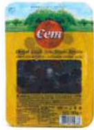
Doğal Sele Siyah Zeytin

Ürün Tanımı: Doğal Yağlı Sele Siyah Zeytin Ürün Kodu: 152.CEM.GYS.V0001 Ambalaj: Vakumlu Ağırlık: 200 gr