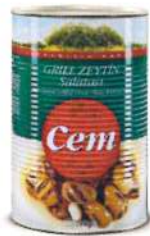
Grill Zeytin Salatası (Yağlı)

Ürün Tanımı :Grill Zeytin Salatası Ürün Kodu :152.CEM.GRL.T0006 Ambalaj :Teneke Ağırlık :3 Kg